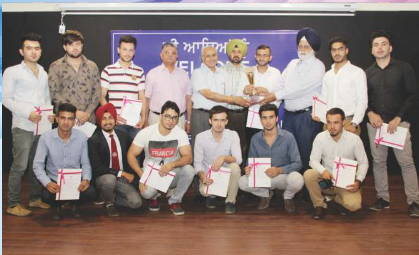
Panjab University Folk Dance Team which represented India in 9 th South Asian Universities Festival- 2016 at Babasaheb Bhimrao Ambedkar University, Lucknow from Feb. 25 to 29, 2016, with the University officials during the annual function of the Department of Youth Welfare