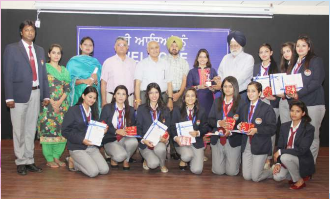
ਨਾਰਥ ਜ਼ੋਨ ਅੰਤਰ ਯੂਨੀਵਰਸਿਟੀ ਯੂਥ ਫੈਸਟੀਵਲ ਵਿਚ ਤੀਜਾ ਸਥਾਨ ਪ੍ਰਾਪਤ ਕਰਨ ਵਾਲੀ ਪੰਜਾਬ ਯੂਨੀਵਰਸਿਟੀ ਦੀ ਰਾਜਸਥਾਨੀ ਡਾਂਸ ਦੀ ਟੀਮ ਦੇ ਮੈਂਬਰ ਸਲਾਨਾ ਸਮਾਗਮ ਮੌਕੇ ਯੂਨੀਵਰਸਿਟੀ ਕਲਰ ਲੈਣ ਉਪਰੰਤ