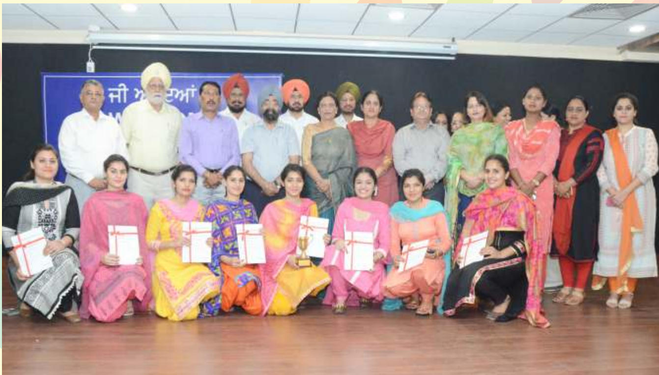
Panjab University Gidha Team (Dev Samaj College for Women, Ferozepur) who won first position during the Punjab State Inter University Youth Festival organized by Directorate of Youth Services, Govt. of Punjab