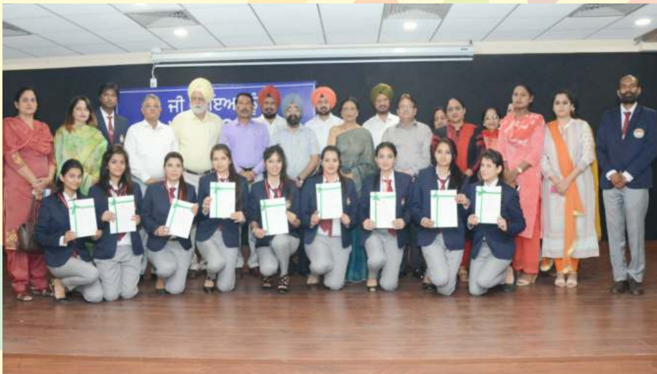
Panjab University Group Dance Team (Dev Samaj College for Women, Ferozepur) who got fourth position in All India National Inter-University Youth Festival held at Shivaji University, Kolhapur (MP)