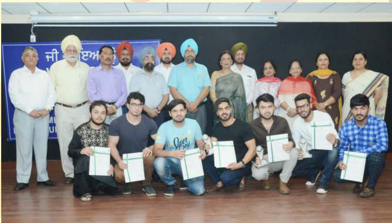
Panjab University Afghani Folk Dance Team (S.G.G.S. Khlasa College, Chandigarh) who participated in 11th SAUFEST at Devi Ahilya Vishwavidyalaya, Indore (MP)