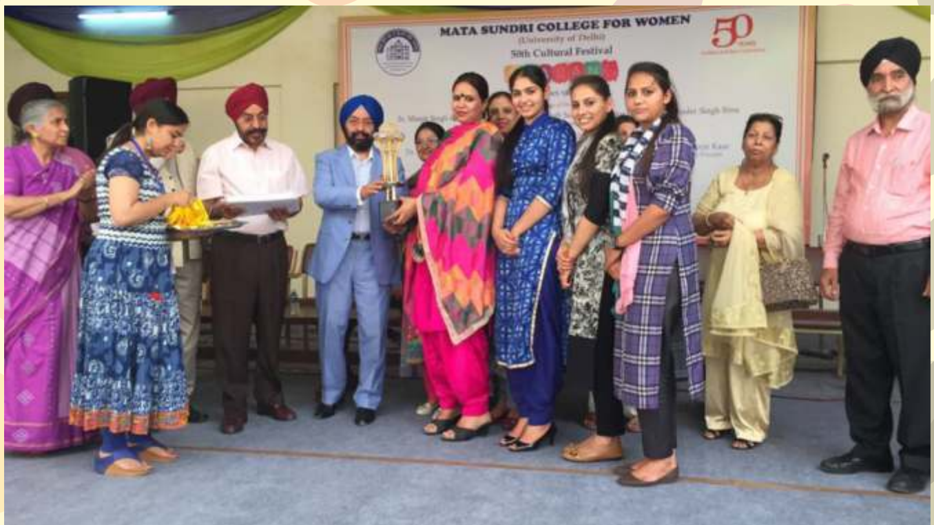
Panjab University Team (National College for Women, Machhiwara) Receiving "Mata Sundri Trophy" during the Inter-State University Cultural Competition held at Mata Sundri College, University of Delhi