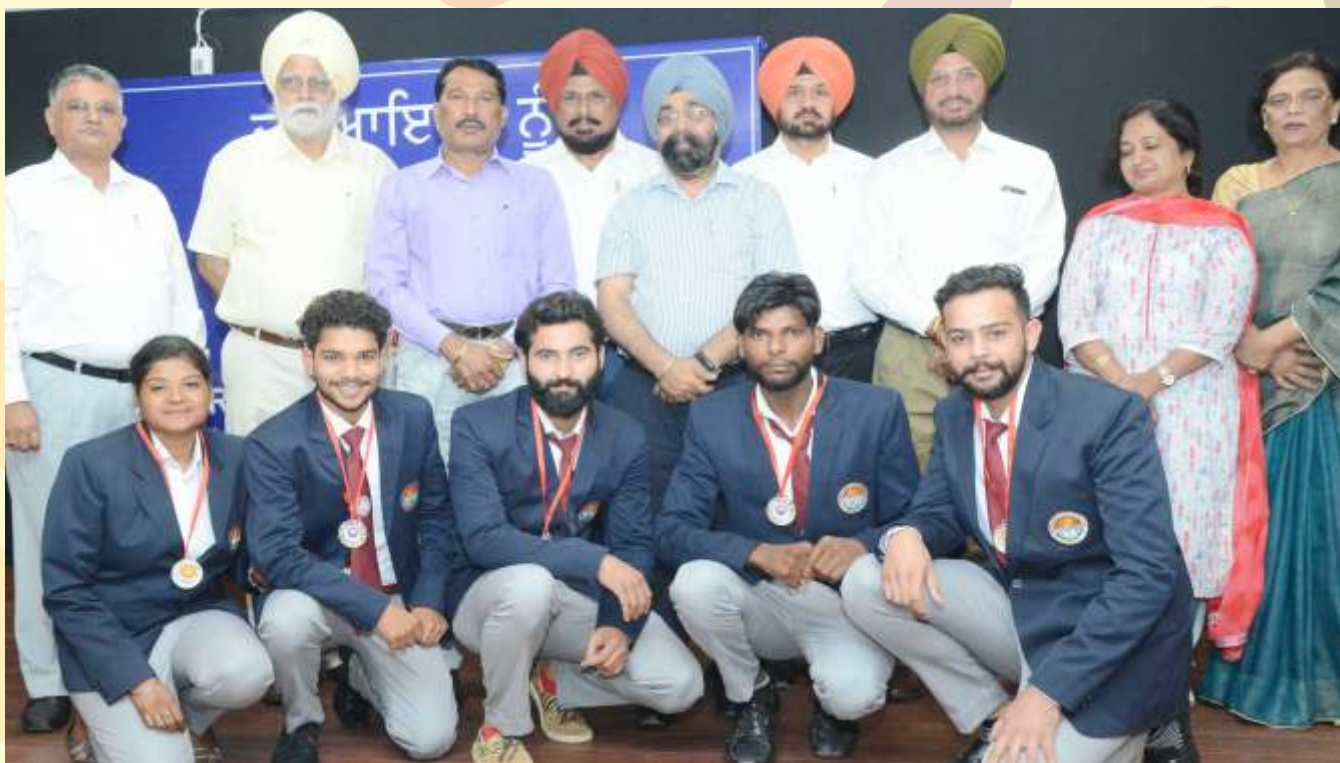
Panjab University One Act Play Team (Baba Kundan Singh College, Muhar) who participated in North Zone Inter-University Youth Festival held at Chhatrapati Chhahuji Maharaj University, Kanpur (UP)