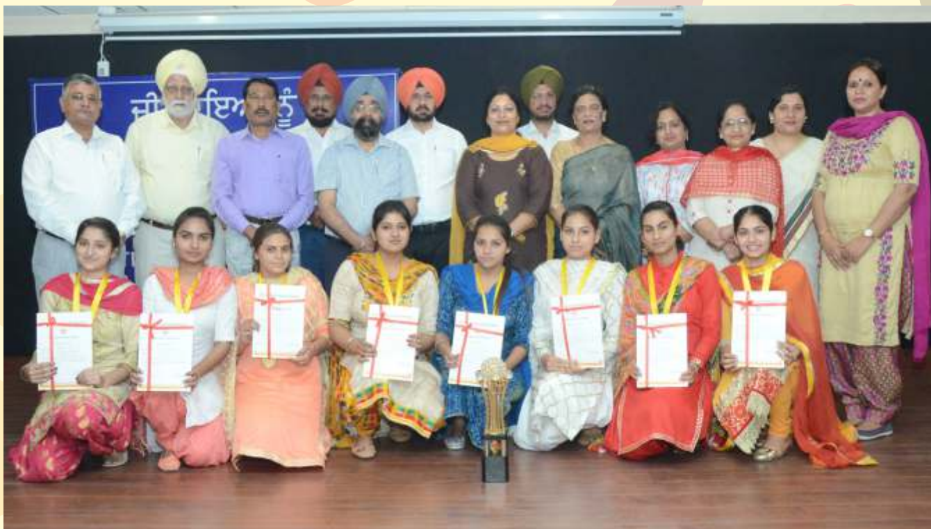
Panjab University Heritage Team (National College for Women, Machhiwara) while receiving “Panjab University Colour” for their victory at Inter-State University Cultural Competition held at University of Delhi